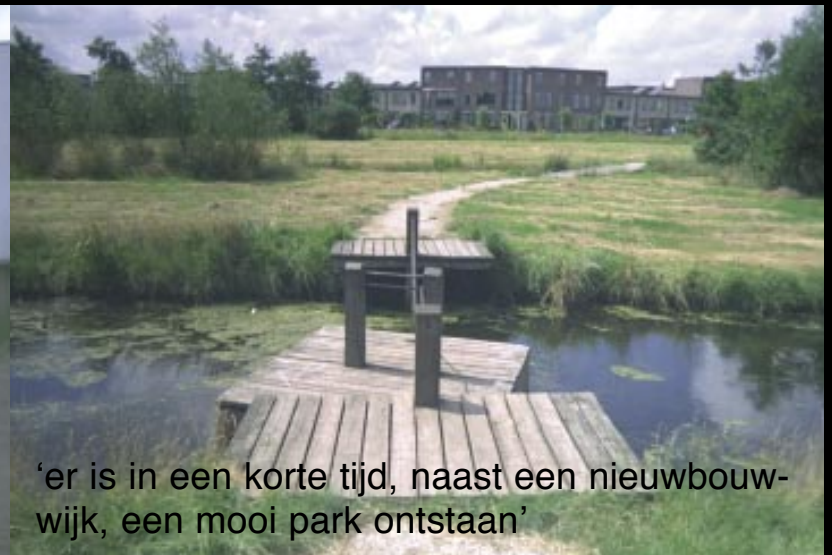
‘er is in een korte tijd, naast een nieuwbouwwijk, een mooi park ontstaan’