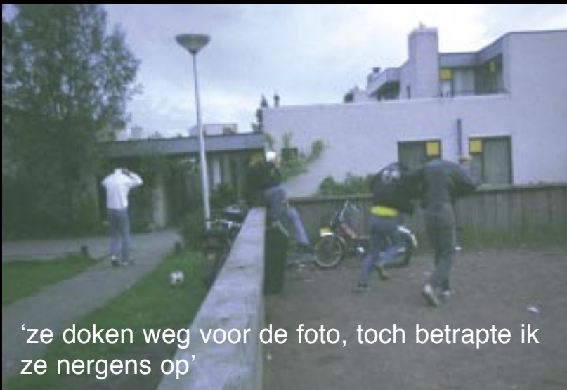
‘ze doken weg voor de foto, toch betrapte ik ze nergens op’