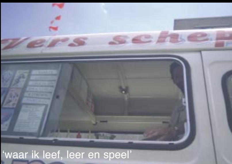
‘waar ik leef, leer en speel’